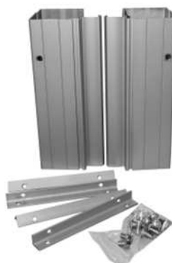
Prodloužení pro PYLON AL jednoduchý. Sada není součástí výrobku PYLON AL.