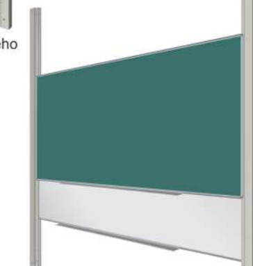
Sestava PYLONU AL dvojitého s jednodílnými keramickými tabulemi ŠKOL K a MANAŽER K